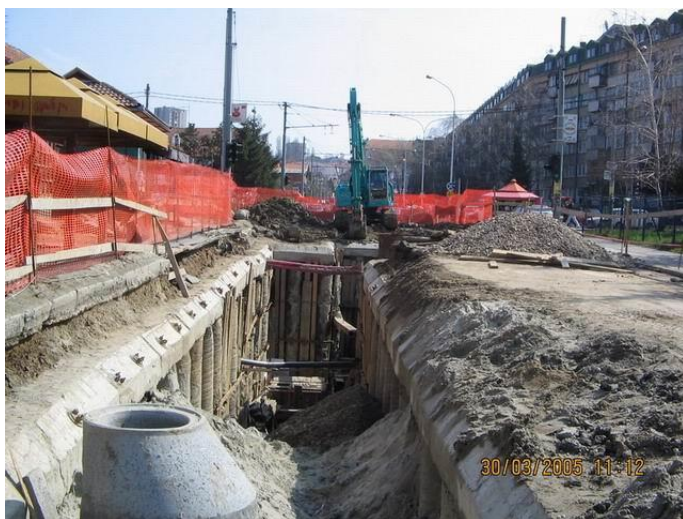
Slika 27. Izgradnja kolektora Duboki potok u otvorenom iskopu